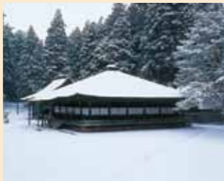
อาคารมื่อโคยะ (Mie-do Hall) MAP-⑤

เจดีย์แห่งนี้ได้รับการบูรณะในปีค.ศ. 1937 และมีความสูงถึง 48.5 เมตร เป็นสัญลักษณ์ซึ่งแสดงถึงนิยามวัชรยานได้อย่างดี