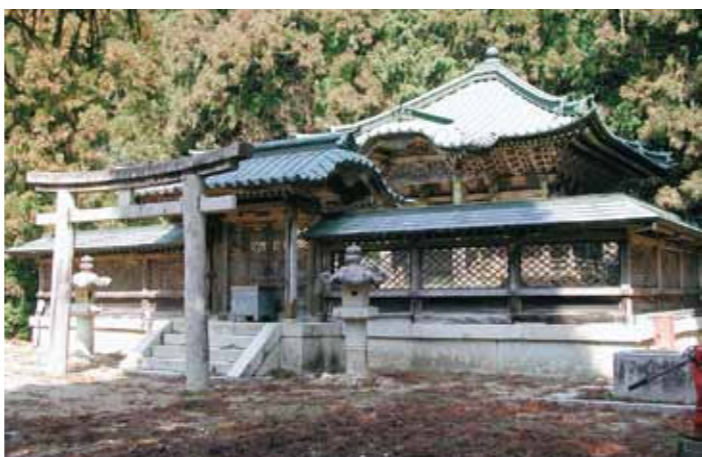
สุสานตระกูลโทกุงะวะ (Tokugawa Mausoleum) MAP-⑥

เนื่องจากโคยะซังเป็นสถานที่ศักดิ์สิทธิ์สำหรับฝึกปฏิบัติธรรม ผู้หญิงไม่ได้รับอนุญาตให้เข้ามาในบริเวณนี้จนถึงปีค.ศ. 1872 ในอดีต จึงมีการก่อสร้างอาคาร "นิยอนินโด" หรือ "หอบูชาสำหรับสตรี" ตรงทางเข้าสู่โคยะซังทั้งหมดเพื่อให้ผู้หญิงสามารถเข้ามากราบไหว้สวดมนต์ได้ ปัจจุบัน เหลืออาคารนิยอนินโดเพียงแห่งเดียว ชมที่หน้าถึงสถูปผู้จาริกแสวงบุญในอดีตเป็นอย่างดี