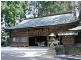
อาคารนิยอนินโด (Nyonin-do Hall) MAP-⑤

ในปีค.ศ. 1593 ท่านโชกุนโตโยโตะ อิเคฮะชิโรสร้างวัด "เซ็งจิ" ขึ้นเพื่อเป็นการทำบุญให้แก่บรรดาที่เสียชีวิต ในปีค.ศ. 1869 วัดนี้ได้รับการสถาปนาให้เป็นวัดหลักในโคยะซัง และเปลี่ยนชื่อเป็นวัด "คองโกบุจิ" ปัจจุบัน วัดเป็นศูนย์กลางของนิกายวัชรยาน และสาขากว่า 3,600 สาขาทั่วประเทศ