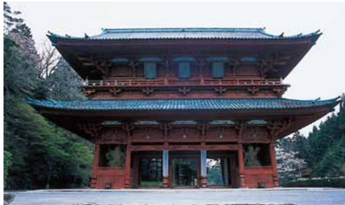
ประตูไดมง (Dai-mon Gate) MAP-①

ประตูหลักสู่เขตโคยะซัง ได้รับการบูรณะในปีค.ศ. 1705 ตัวประตูถูกสร้างจากแผ่นไม้ 2 ชั้น มีความสูง 25.1 เมตร โดยมีเทพเจ้าผู้ปกป้อง "คองโกริซึชิ" ยืนอยู่ทั้ง 2 ด้าน