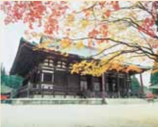
อาคารกงโด (Kon-do Hall) MAP-⑥

ทานโคโบไดชิสร้างอาคารขึ้นเพื่อบรรจุพระพุทธรูปบูชา และเป็นสถานที่สำหรับสวดมนต์ภาวนา อาคารปัจจุบันเป็นอาคารที่ถูกรื้อถอนในปีค.ศ. 1848 หลังคาที่มีมุมนลาดเอียงหลังคาทำให้อาคารดูอ่อนช้อยสวยงาม เป็นเอกลักษณ์