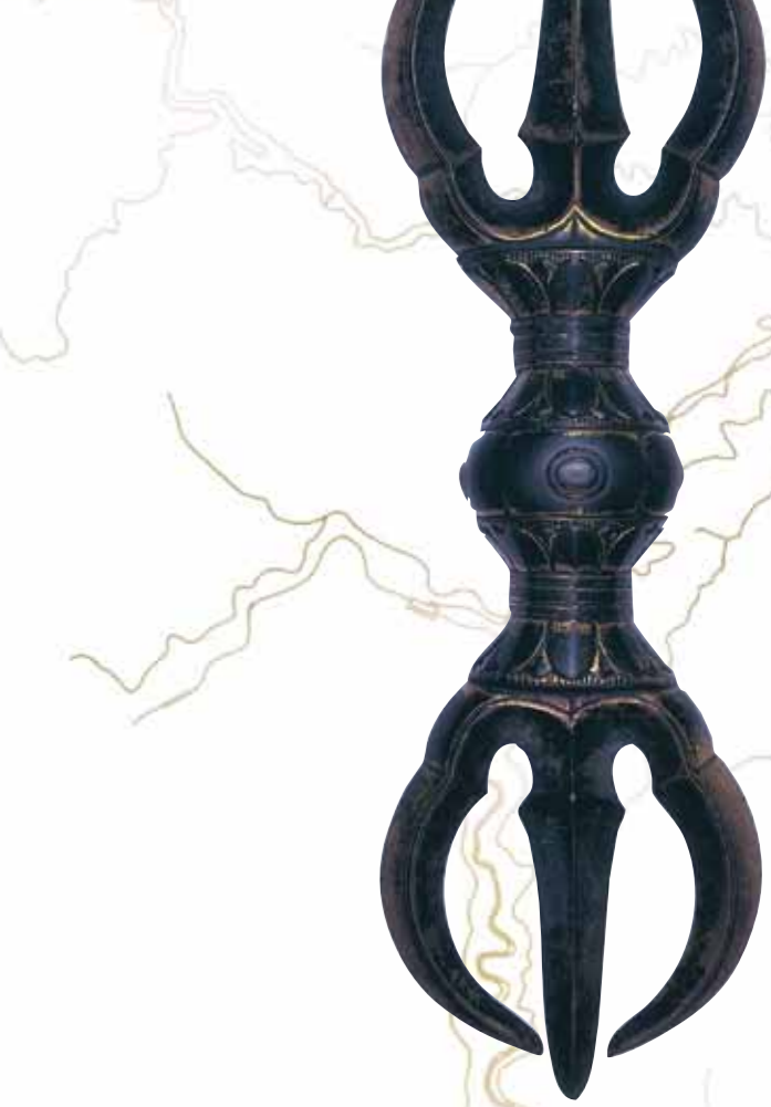
ตรีวัชระ อุปกรณ์ที่พระถือเมื่อประกอบพิธีทางศาสนาพุทธนิกายมหายานหรือวัชรยาน