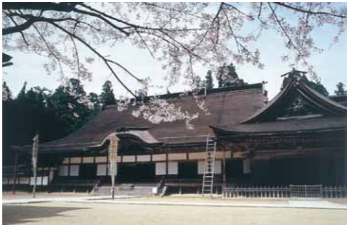
วัดคองโกบุจิ (Kongobu-ji Head Temple) MAP-④

เป็นอาคารที่มีประวัติเล่าว่า ทานอิชิโตะมาได้ตามหาบิดา ซึ่งออกบวชที่โคยะซังตั้งแต่ยังหนุ่ม หลังเผชิญความทุกข์ยากต่างๆ ท่านอิชิโตะมาคิดถึงใจของบิดาและได้พบท่านคารุกะโยไดชิ ซึ่งบิดาแห่งตน ท่านคารุกะโยรับท่านอิชิโตะมาปฏิบัติธรรมที่วัดแห่งนี้ โดยยอมเป็นนายธรรมที่แท้จริงของตน ทั้งสองได้ปฏิบัติธรรมด้วยกันที่นี่ ภายในอาคารนี้มีภาพเล่าเรื่องของทั้งสองประทับอยู่เป็นจำนวนมาก